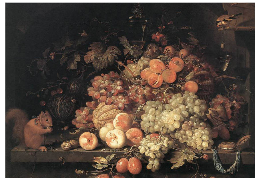
Fruktstilleben med ekorre och steglits (beskuren), cirka 1668, av Abraham Mignon.