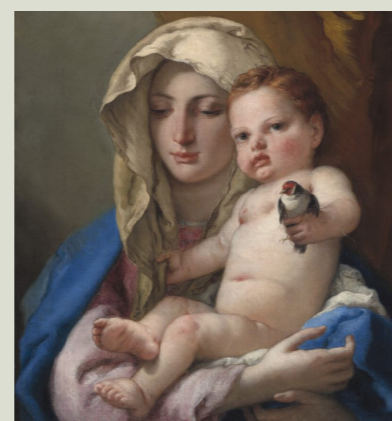
Madonnan och barnet, 1760, av Giambattista Tiepolo.

Men vilken art var det egentligen frågan om? Många fåglar som har något rött i