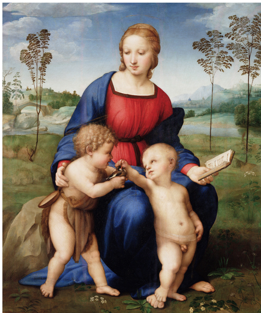
Madonna del cardellino, cirka 1505–1506, av Rafael. Här syns barnet Johannes (sedermera Döparen) hålla en steglits som lille Jesus sträcker sig mot.

LÄT OSS ÄNDÅ börja med duvan. Du har säkert sett bilder med kristna motiv där det förekommer en sådan. Exempelvis så kallade bebådelsebilder. Alltså motiv som visar när ängeln Gabriel berättar för Maria att hon ska föda guds son. Då är oftast en duva närvarande. I själva verket symboliserar duvan den heliga andes närvaro i sådana bilder. Ett annat extra heligt tillfälle som duvan kan bevista är Jesu dop. Ytterligare en duva finns i första Mosebok, i berättelsen om Noa och arken – den duvan avbildas oftast med en olivkvist i näbben. Duvornas symbolik är enkel och inte så mycket att diskutera. Betydligt mer