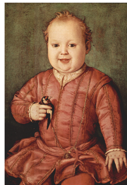
Porträtt av Giovanni de' Medici som barn, cirka 1545, av Agnolo Bronzino.

Steglitsen var dessutom mycket vanligt förekommande som husdjur. De var vackra, sjöng fint och blev lätt tama. Dessutom kunde de hållas i snöre och lära sig trick. Således inte bara en burfågel utan också en levande leksak. Källor menar att