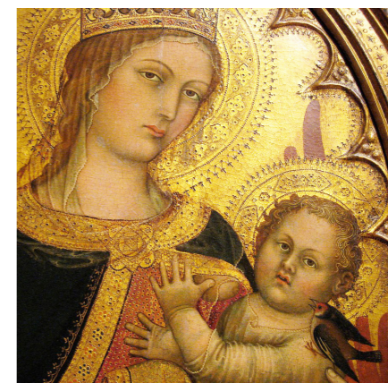
Madonna och barnet (detalj), cirka 1400, av Taddeo di Bartolo.

FÖR EN FÅGELKUNNIG nutidsmänniska kan steglitserna i de gamla bilderna te sig