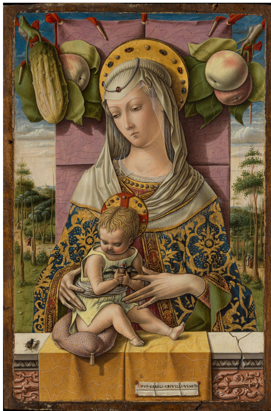
Madonnan och barnet, cirka 1480, av Carlo Crivelli.

böjdpösten härjade som värst i Europa. Att tillfriskna efter ett så svårt sjukdomstillstånd var en slags världslig återuppståndelse. Därför finns en koppling mellan steglitsen som turfågel och konvalescens. Han noterar också att Jesusbarnet i flertalet målningar även bär en annan känd skyddssymbol, nämligen den röda korallen som en amulett runt halsen.