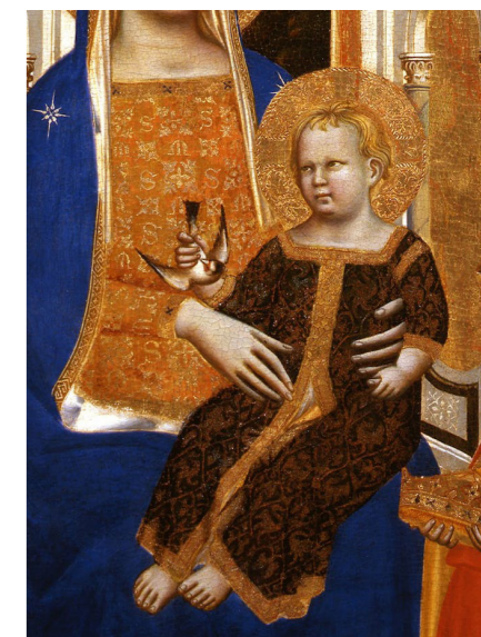
Madonna och barnet med änglar (beskuren), 1355, av Taddeo Gaddi